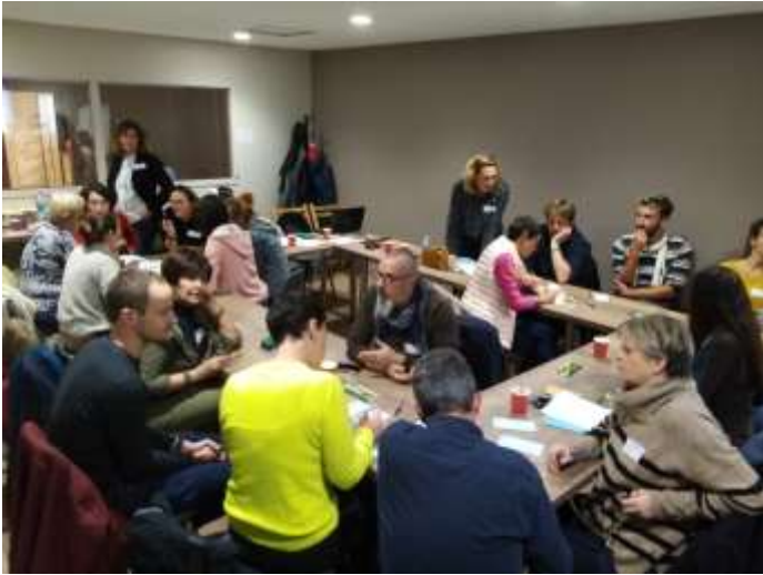
Travail en sous-groupes