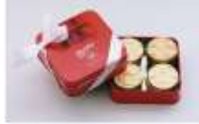
Boîte Tentation palets